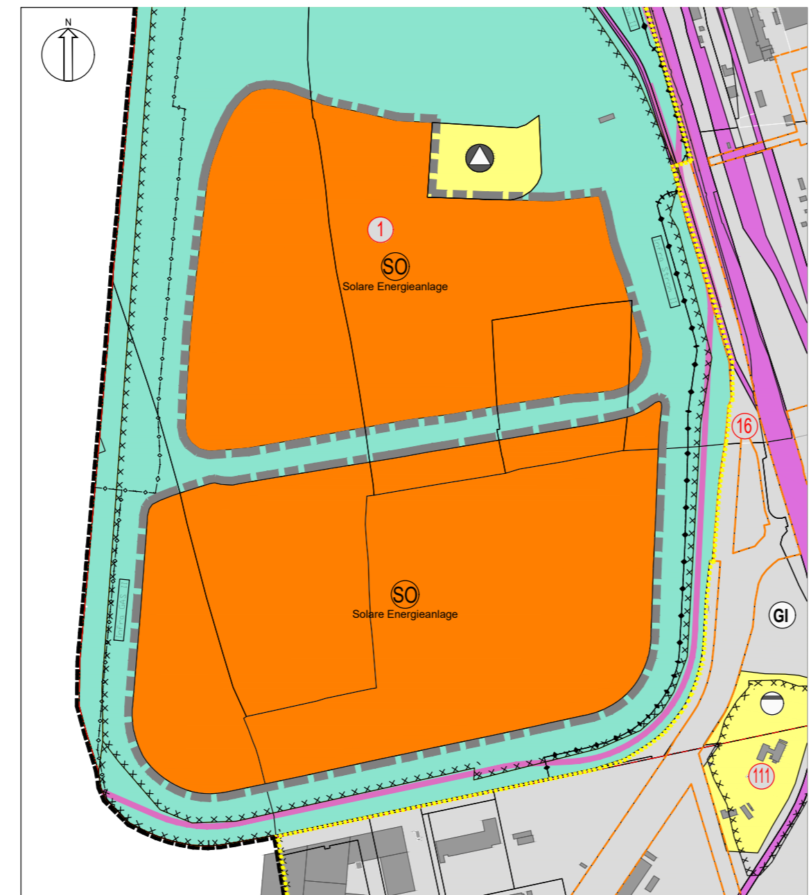
1. Änderung des Flächennutzungsplans Bereich Hochhalde Leuna