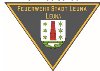
Emblem OF Leuna