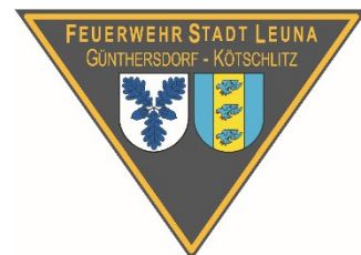
Emblem OF Günthersdorf-Kötschlitz