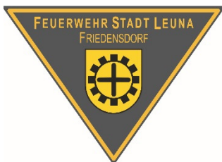
Emblem OF Friedensdorf