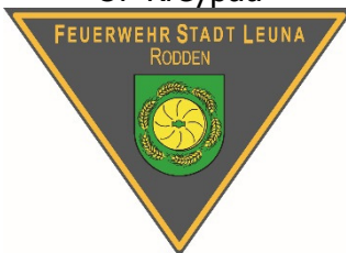
Emblem OF Rodden