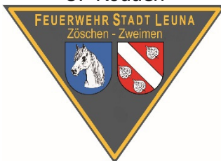
Emblem OF Zöschen-Zweimen