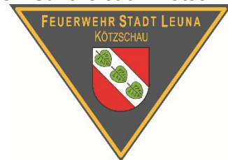
Emblem OF Kötzschau