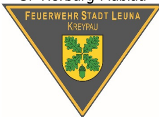
Emblem OF Kreypau