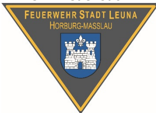
Emblem OF Horburg-Maßlau