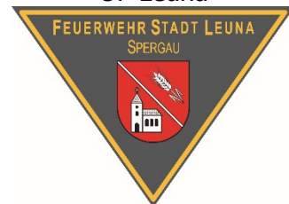
Emblem OF Spergau