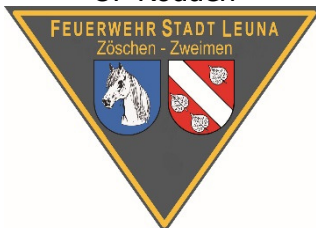
Emblem OF Zöschen-Zweimen