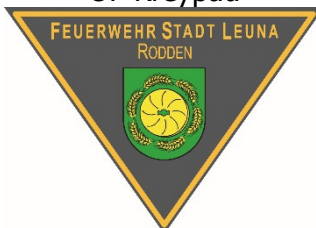
Emblem OF Rodden