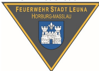
Emblem OF Horburg-Maßlau